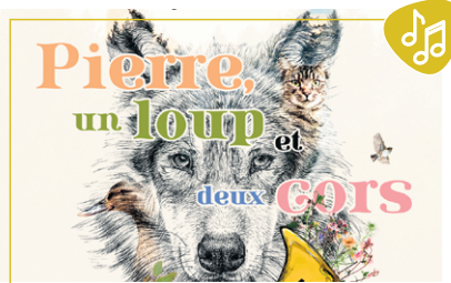
Orchestre symphonique r  gional de l'Abitibi-T  miscamingue